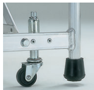
移動に便利なスプリングキャスター(φ40)付